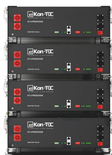
Montaż w szkielet / szafie rack