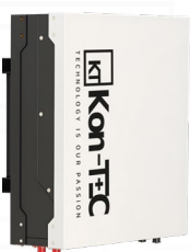
Montaż na ścianie