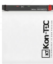
Montaż na podłodze